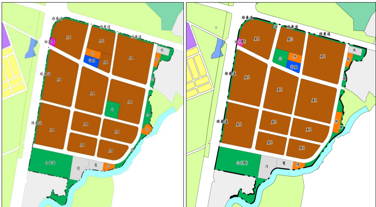
細部計畫示意圖 (修正版)