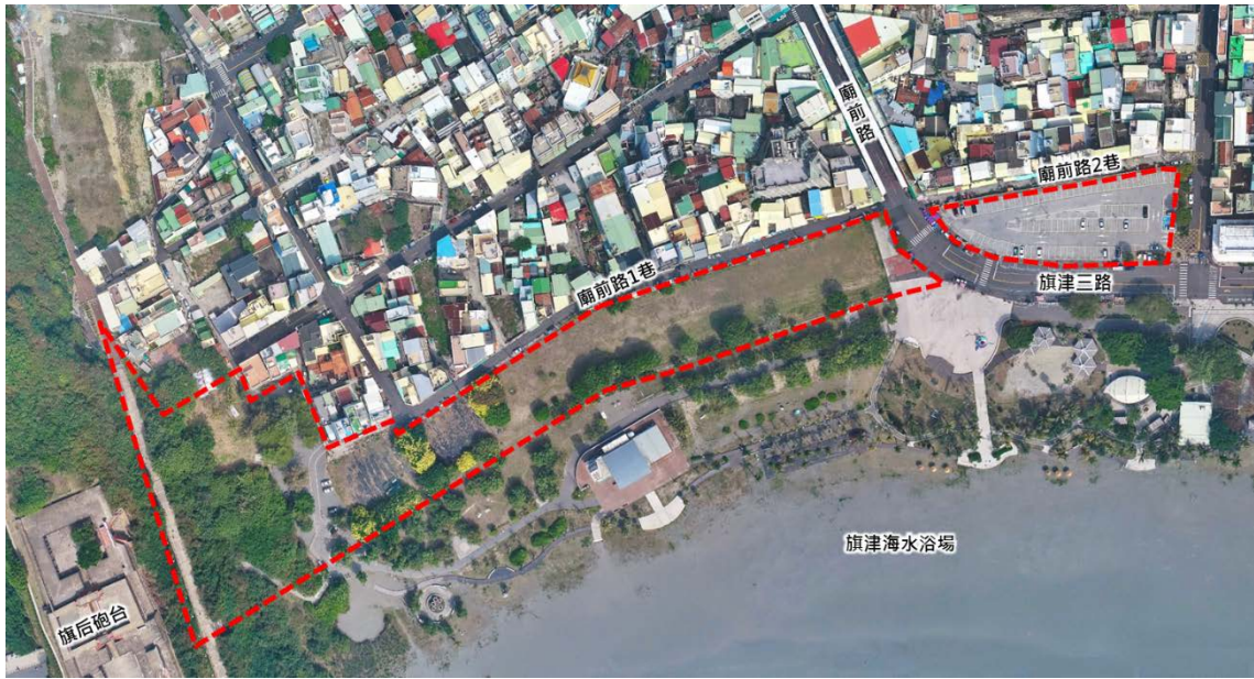
旗津觀光發展專用區現況示意圖