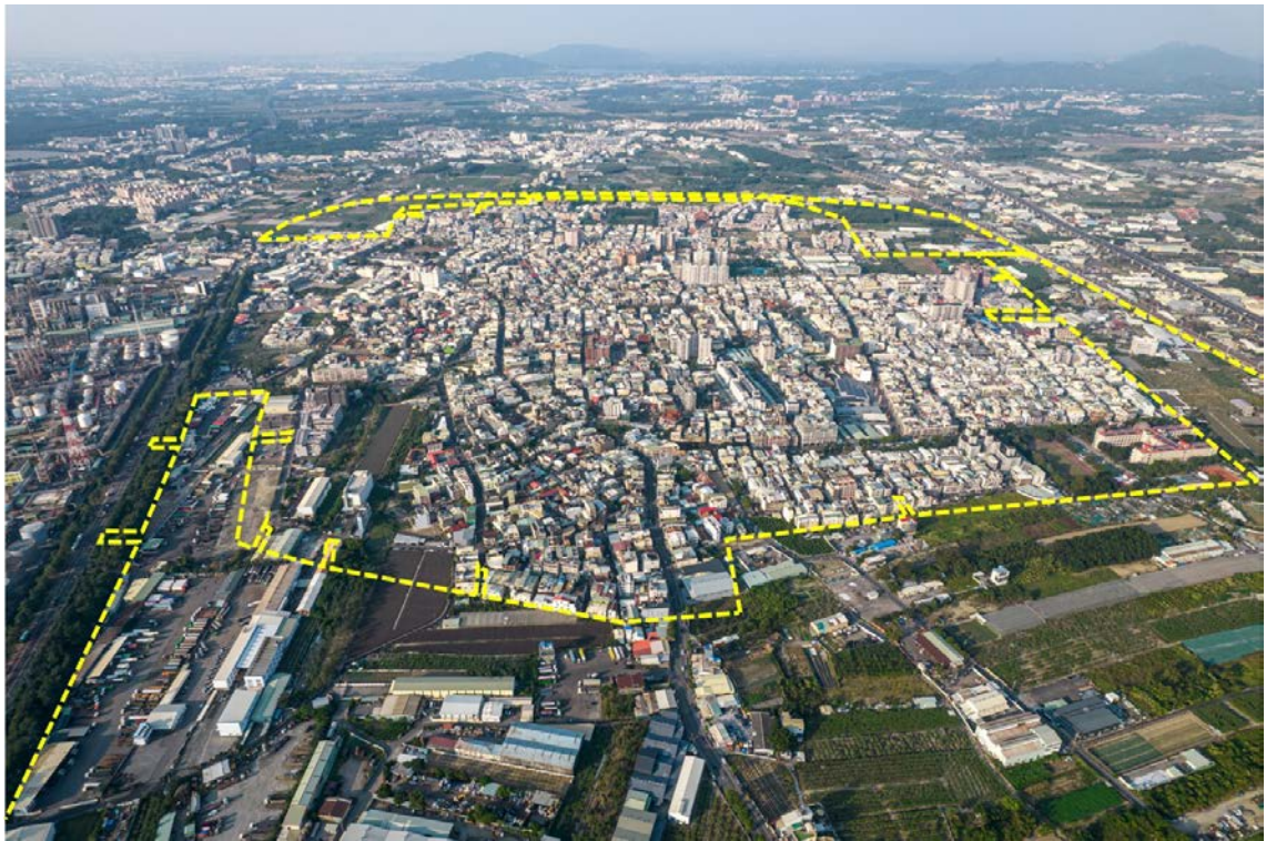
大社都市計畫現況示意圖