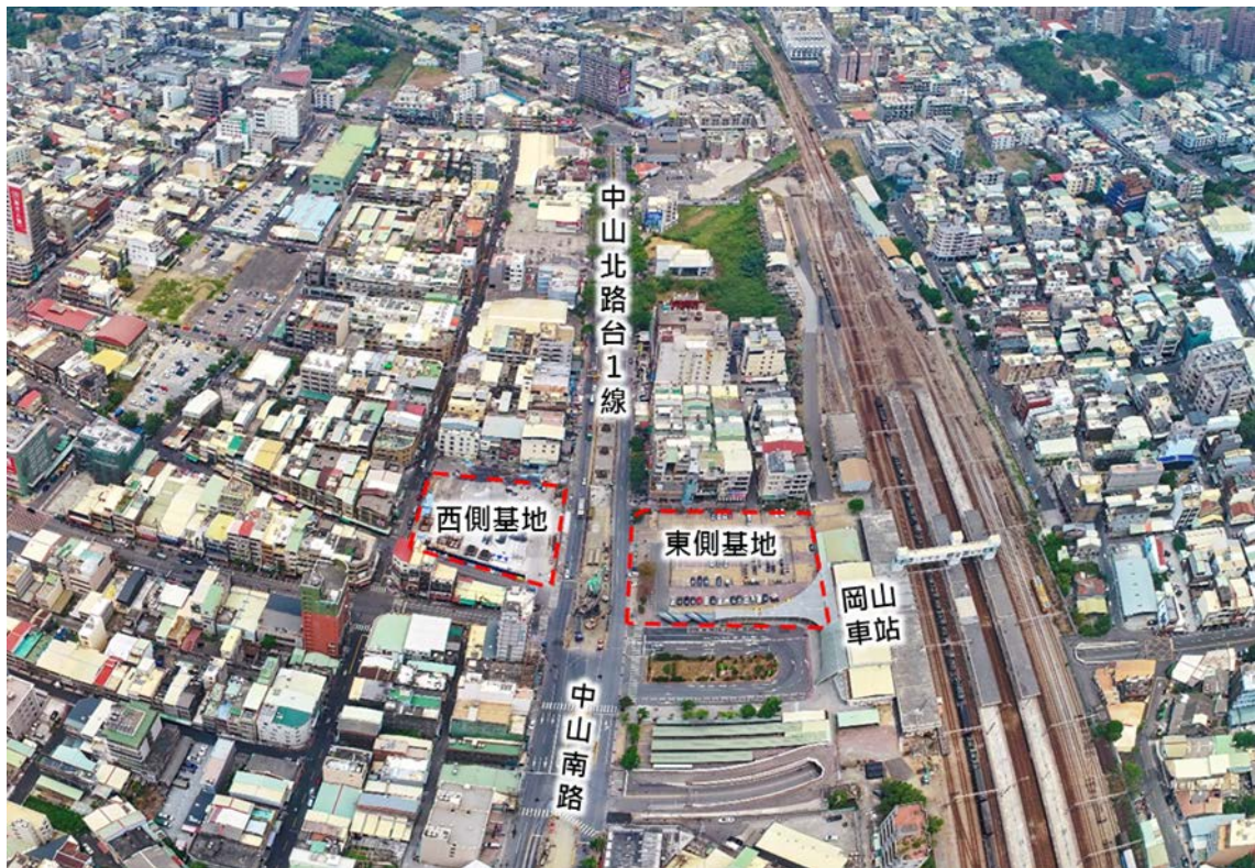
岡山捷運 RK1 站聯合開發現況示意圖 1