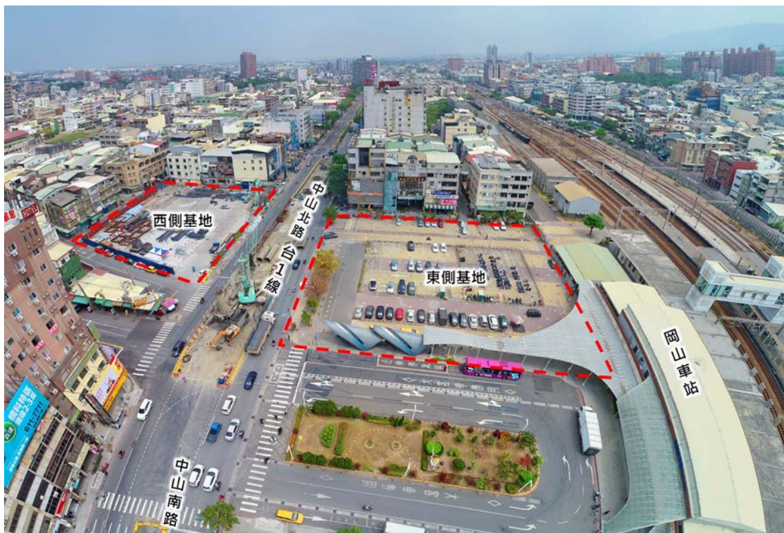
岡山捷運 RK1 站聯合開發現況示意圖 2