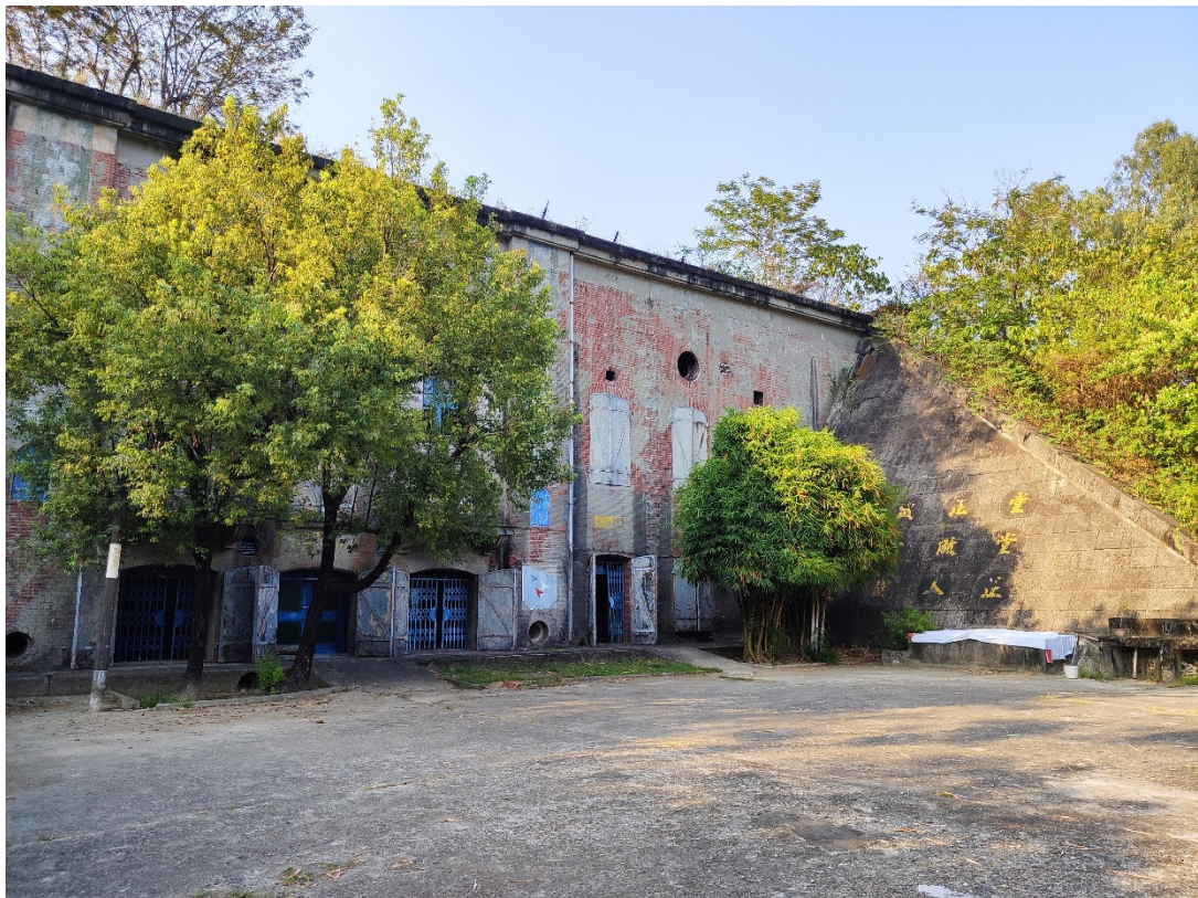
原海軍明德訓練班現況示意圖 4