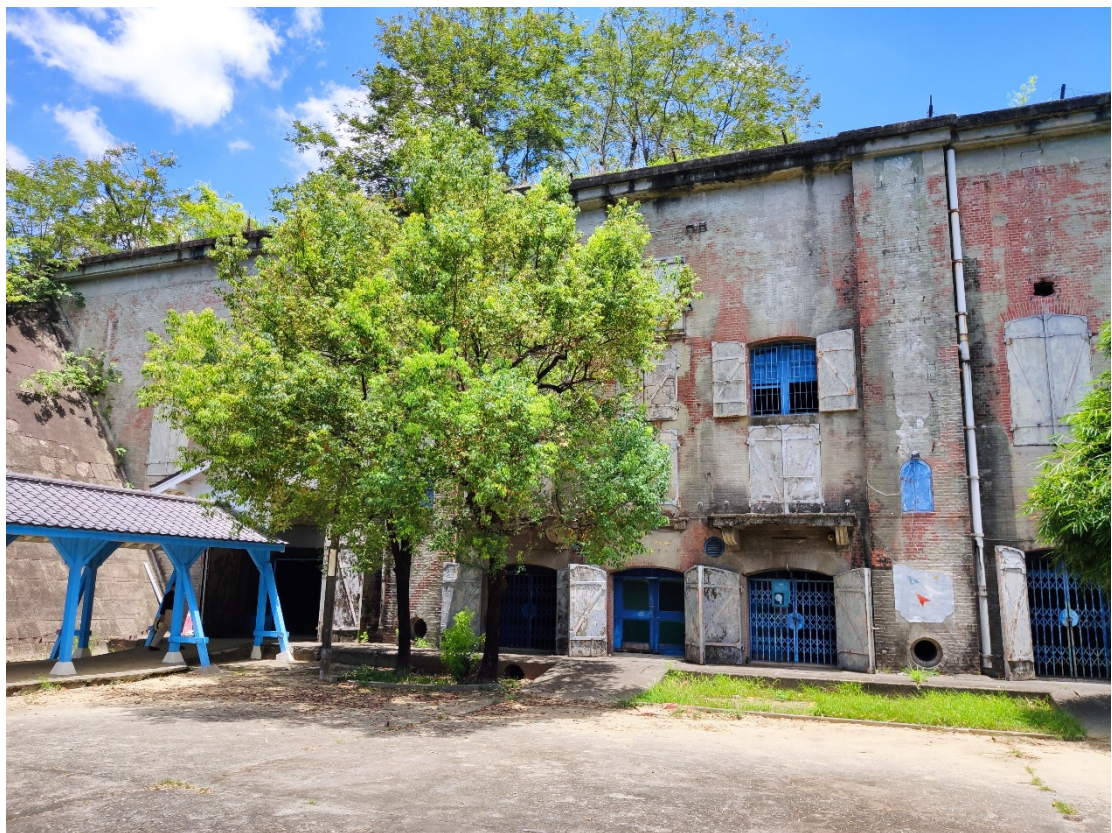
原海軍明德訓練班現況示意圖 2