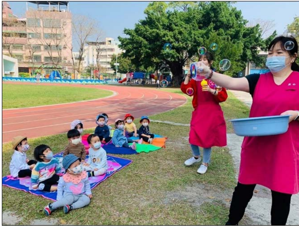
學校閒置校舍作托育中心示意照 1