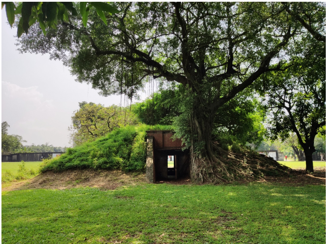
原海軍明德訓練班現況示意圖 6