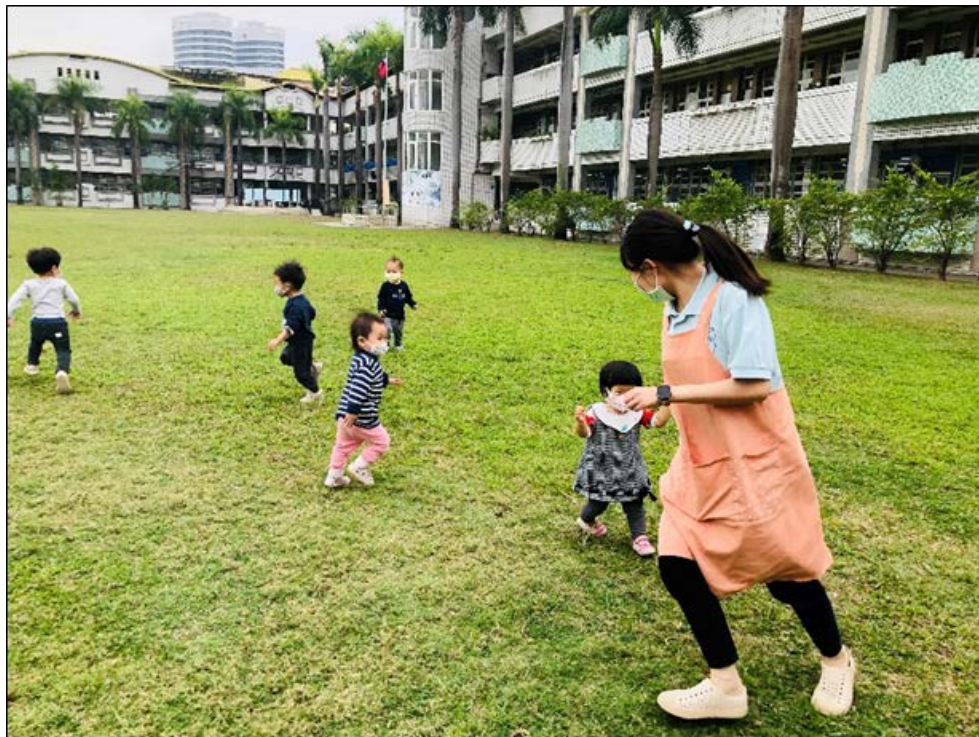
學校閒置校舍作托育中心示意照 2