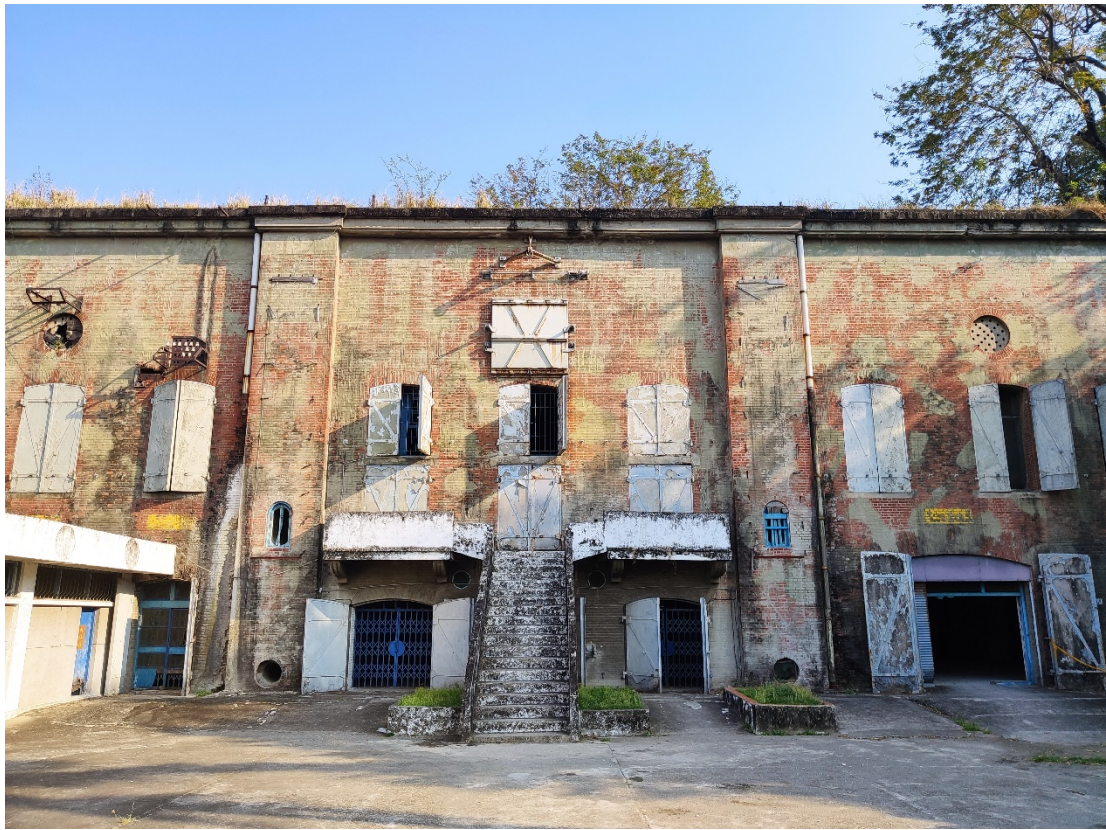
原海軍明德訓練班現況示意圖 3