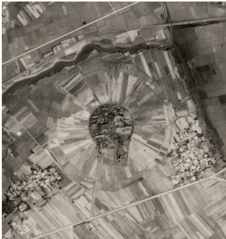
1984 年美軍航拍原日本海軍無線電信所照