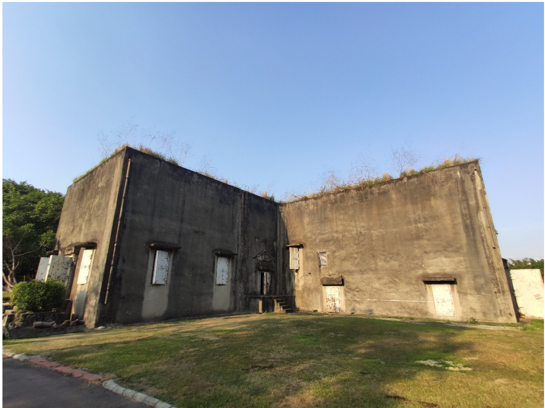
原海軍明德訓練班現況示意圖 5