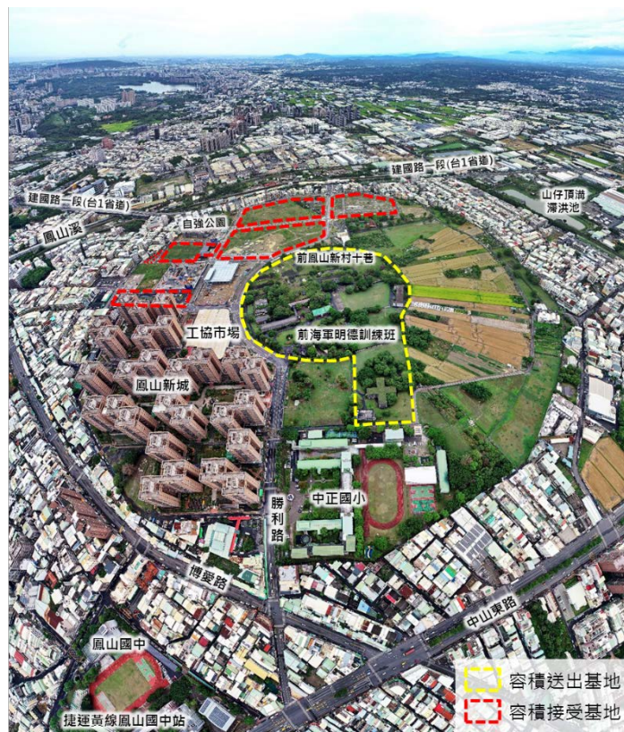
工協新村容積調派現況示意圖