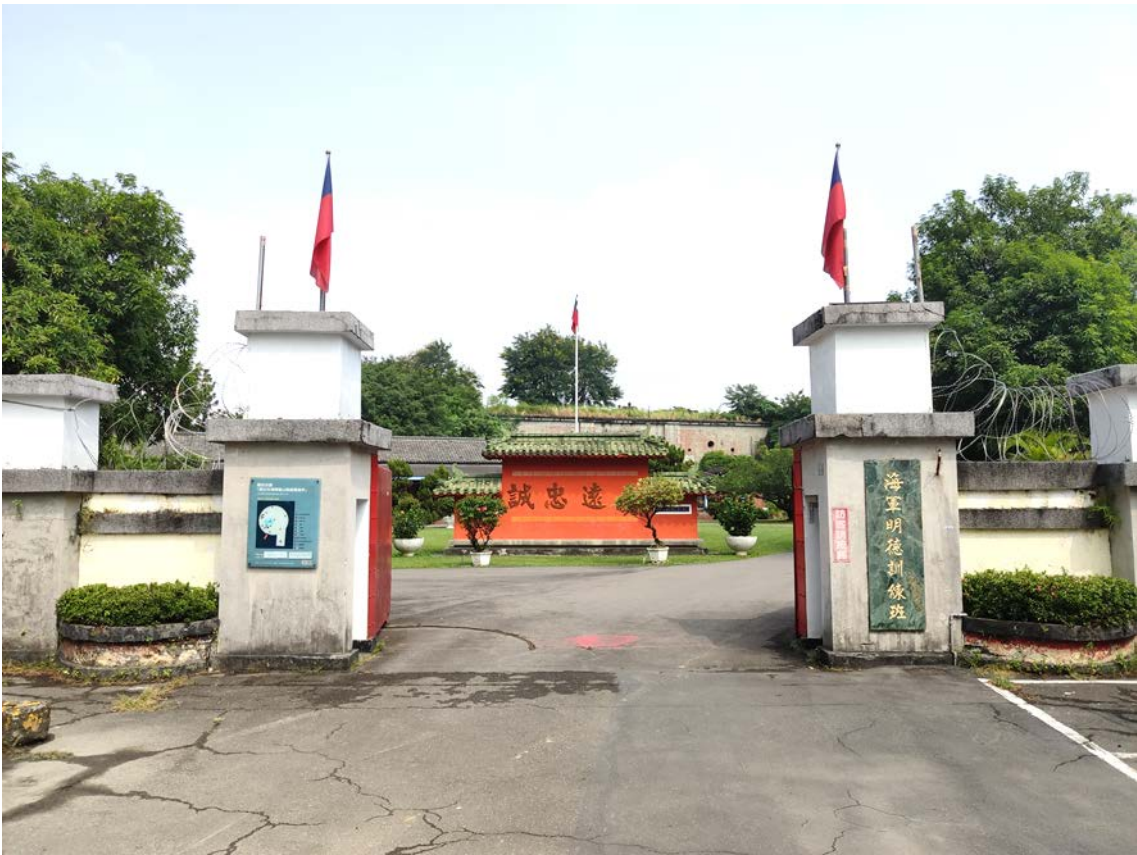
原海軍明德訓練班現況示意圖 1