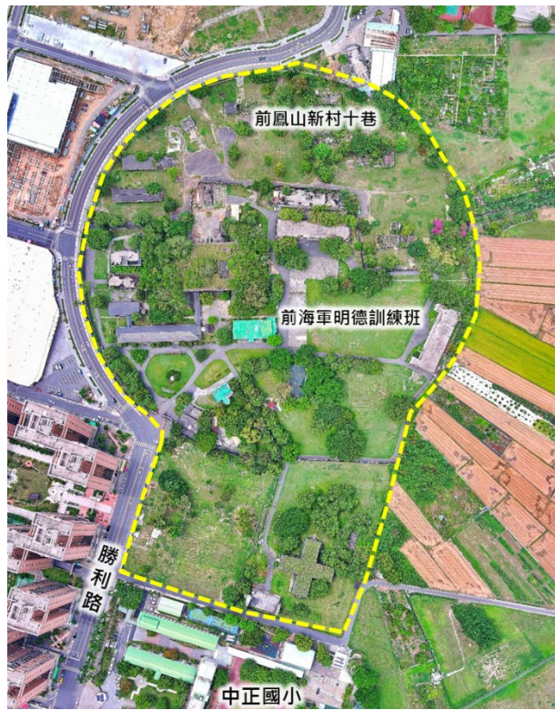
前海軍明德訓練班現況示意圖