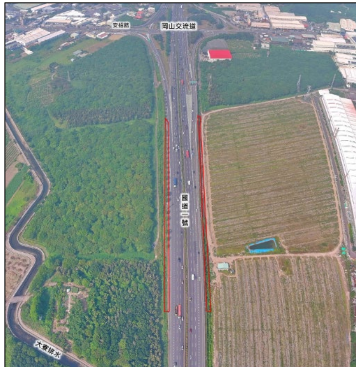
增設橋頭科學園區匝道及聯絡道工程南段現況