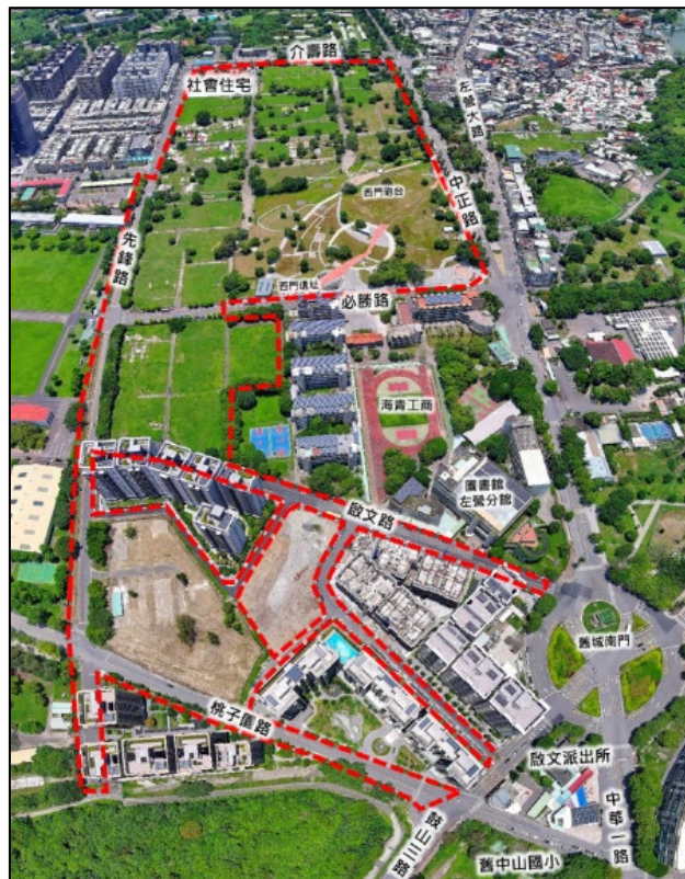
左營崇實、自助、勵志新村現況