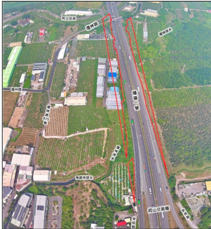
增設橋頭科學園區匝道及聯絡道工程北段現況