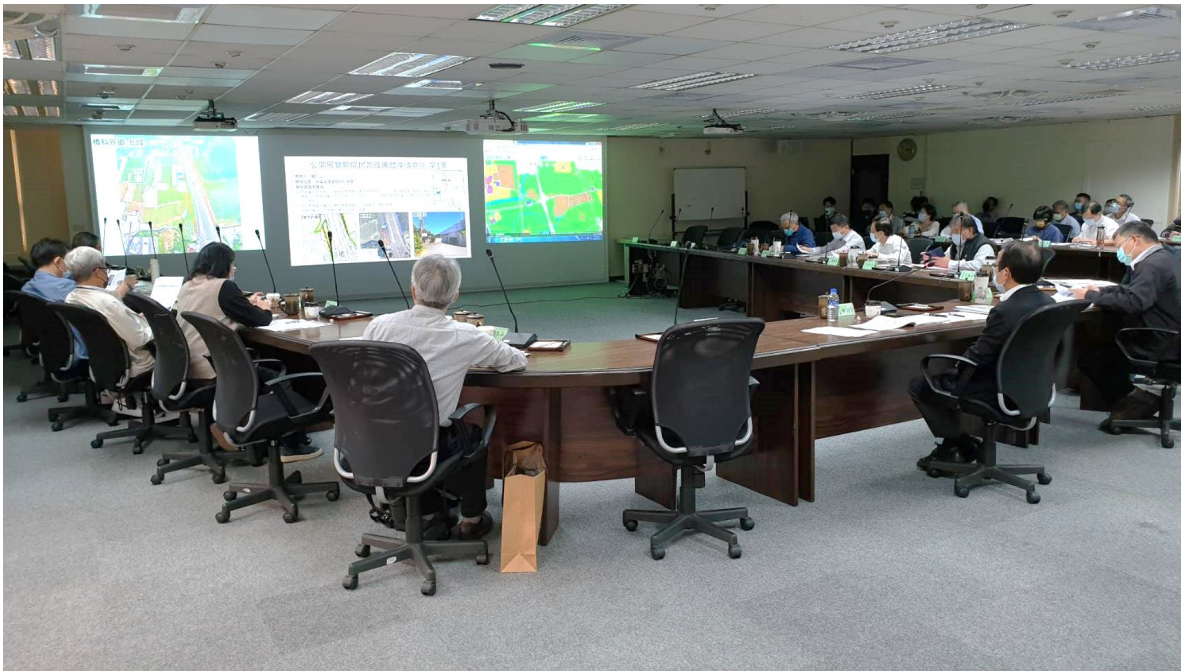
市都委會審議情形