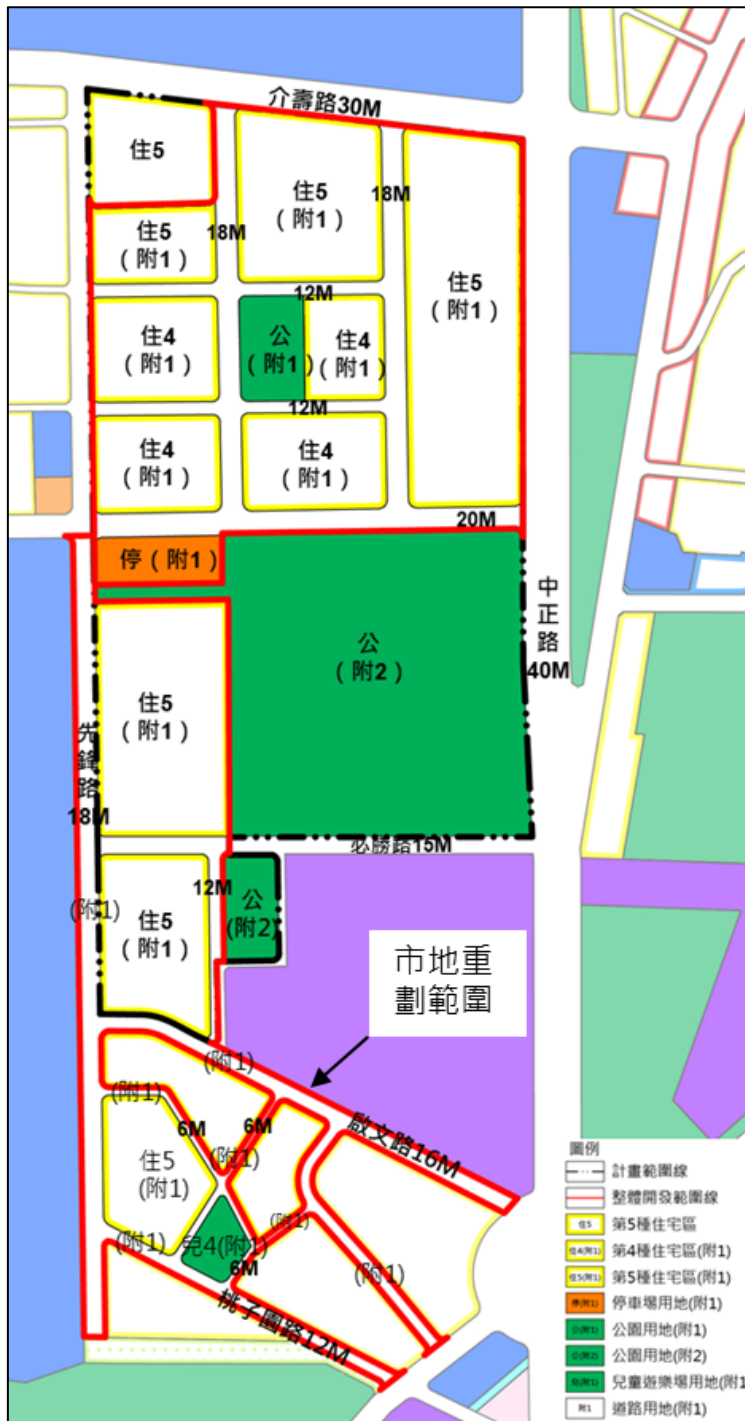
左營崇實、自助、勵志新村變更後都市計畫示意圖