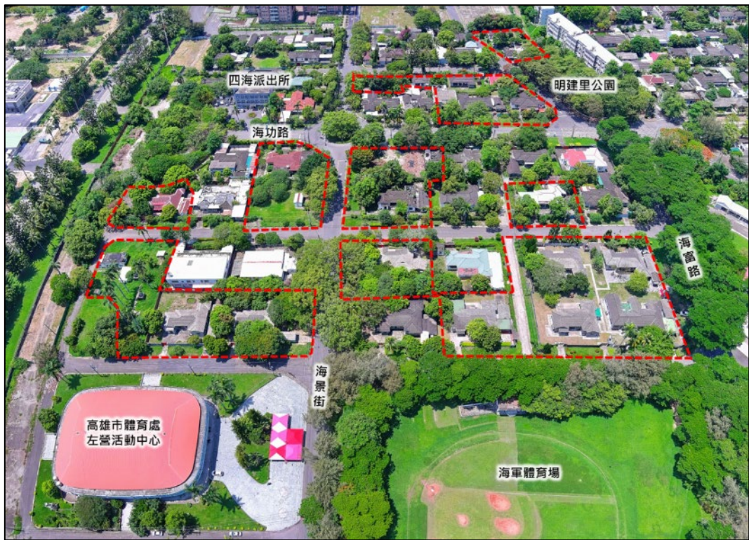
左營明德新村現況