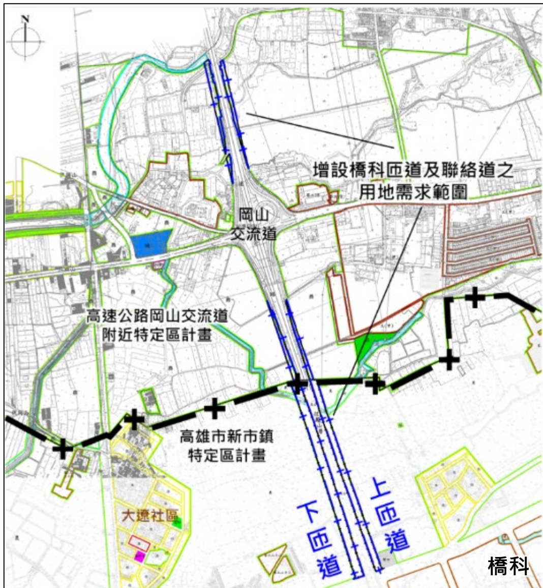
增設橋頭科學園區匝道及聯絡道工程範圍示意圖