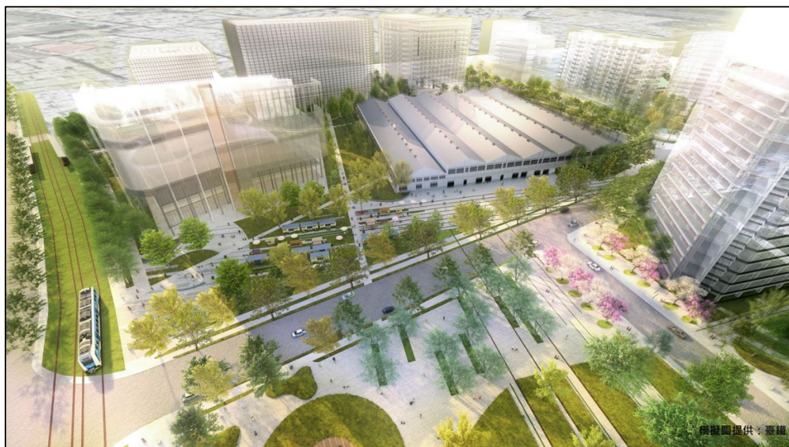
A-1 與 A-2 街廓模擬圖