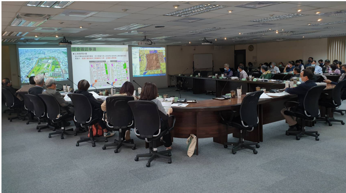
市都委會審議情形