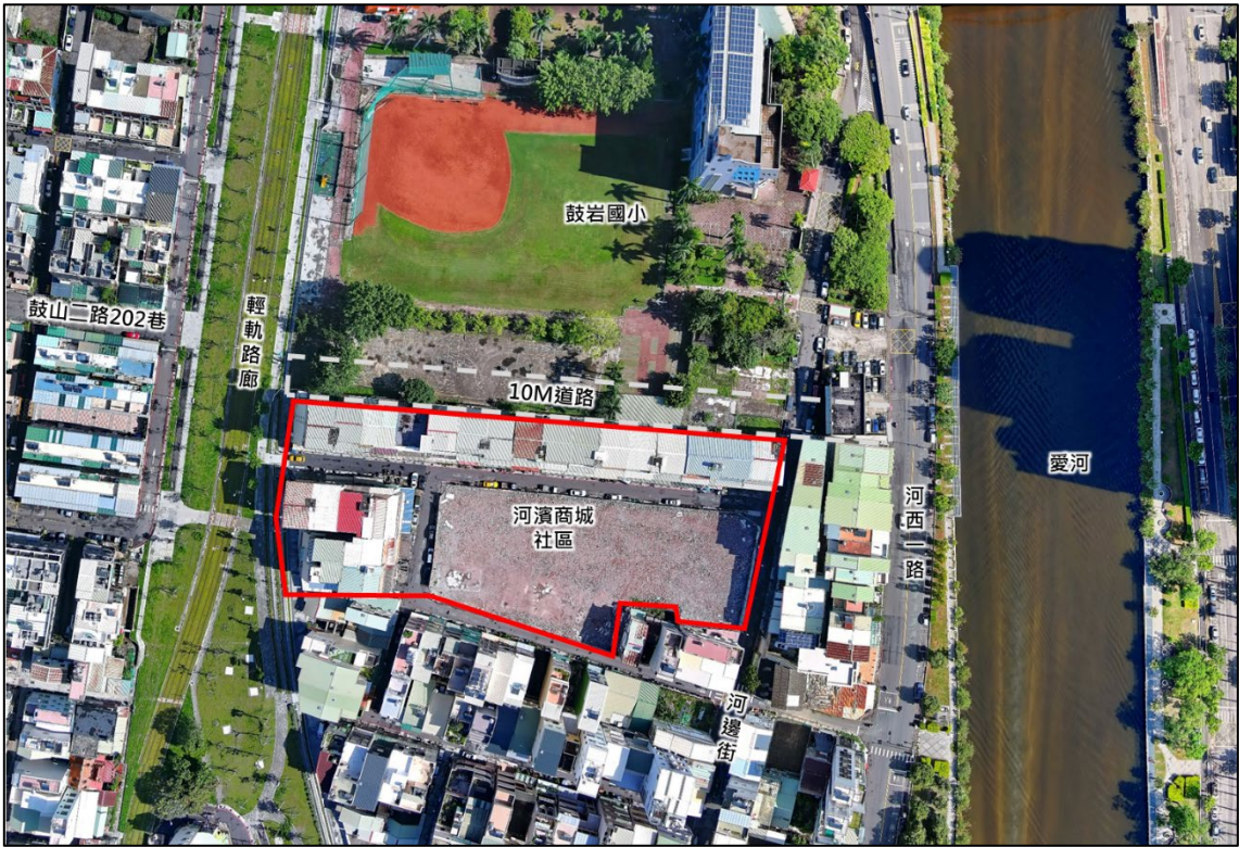
河濱商城社區現況