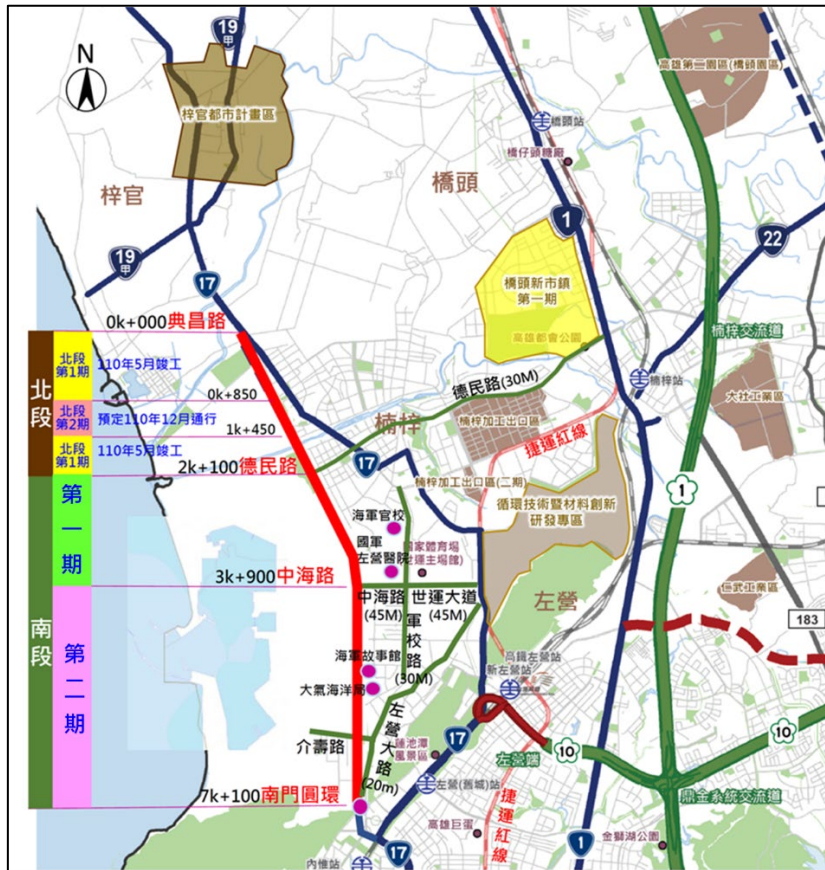
新台 17 線區域交通路網示意圖