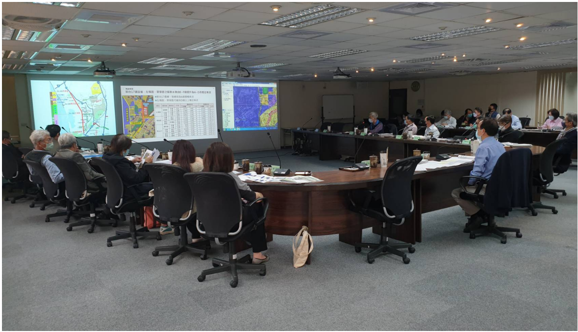
市都委會審議情形