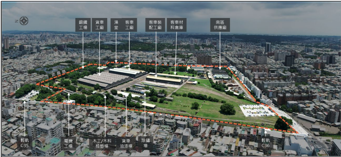
台鐵高雄機廠現況