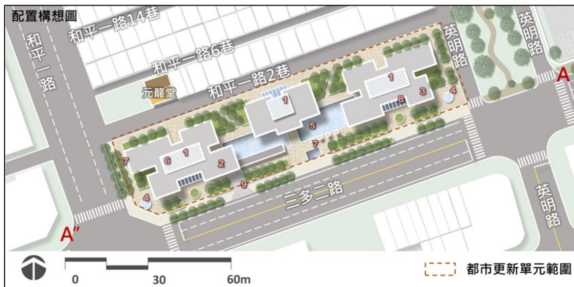
苓雅清潔隊都市更新開發建築配置模擬示意圖