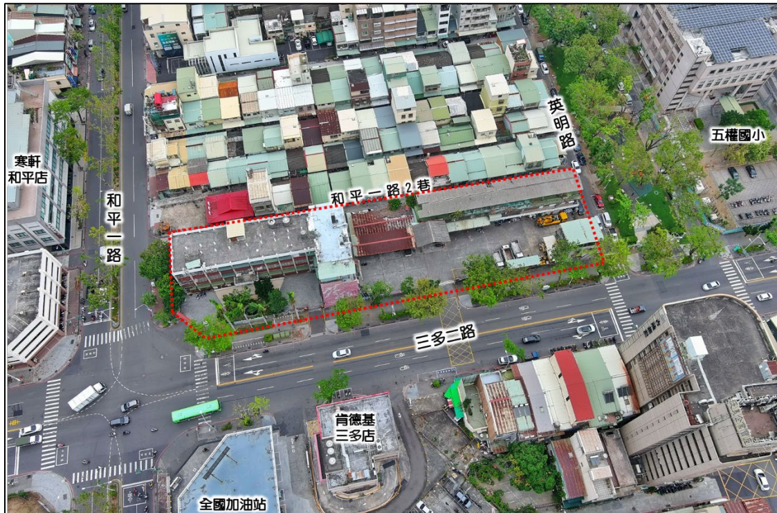
苓雅清潔隊現況圖