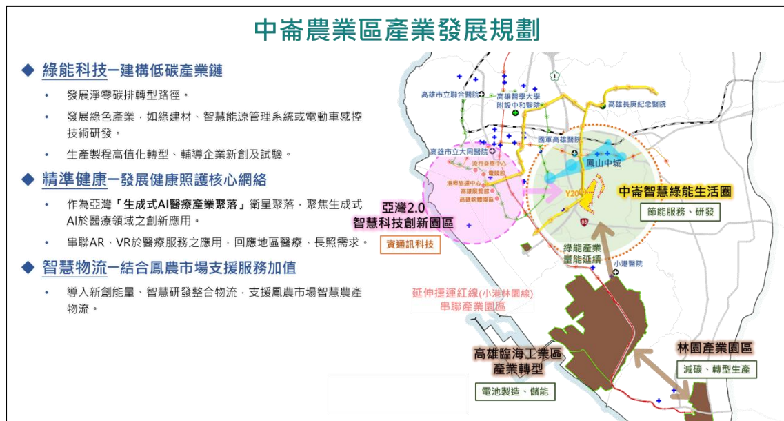
中崙農業區發展規劃