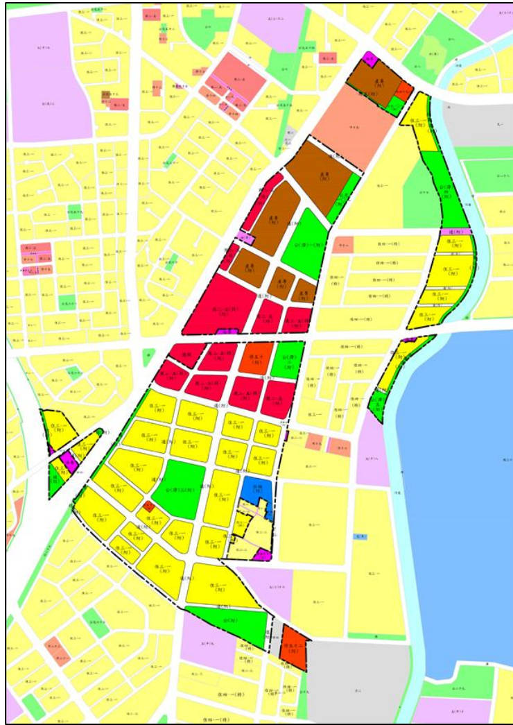
鳳山中崙農業區細部計畫變更方案示意圖