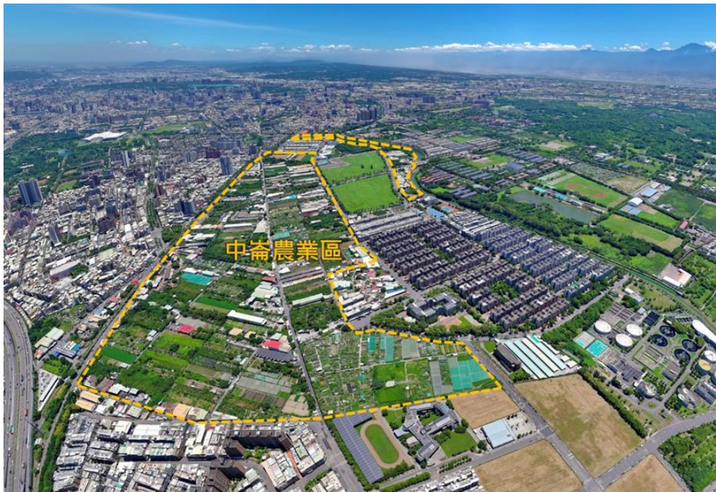
鳳山中崙農業區空照圖