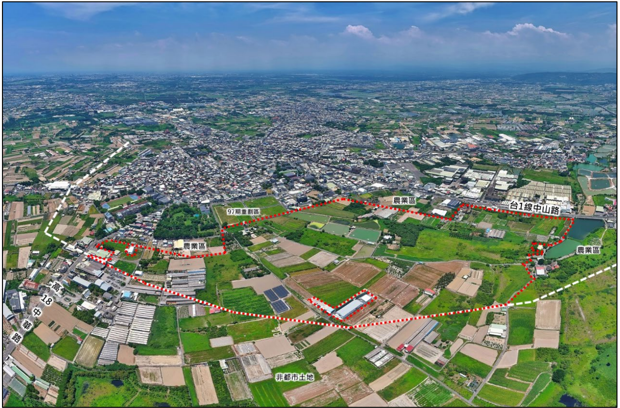
台一線以西農業區現況圖