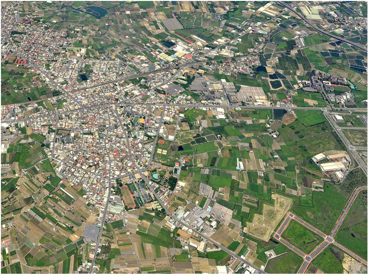
路竹都市計畫區現況圖